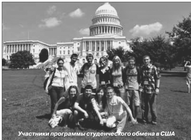
Участники программы студенческого обмена в США